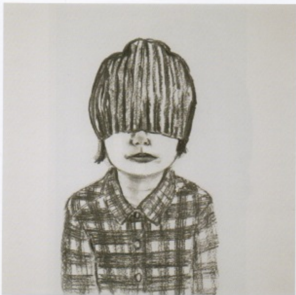
A Tissulo, fusain et pierre noire sur papier 40 cm x 40 cm, 2015.

Parfois le sujet dévisage le spectateur, mais le plus souvent, il est absorbé dans ses pensées, semble indifférent à ce qui l'entoure.