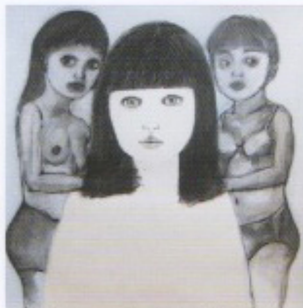
« Mater » - fusain, pierre noire et craie sur papier - (40 x 50 cm) - 2011 © I. Durk