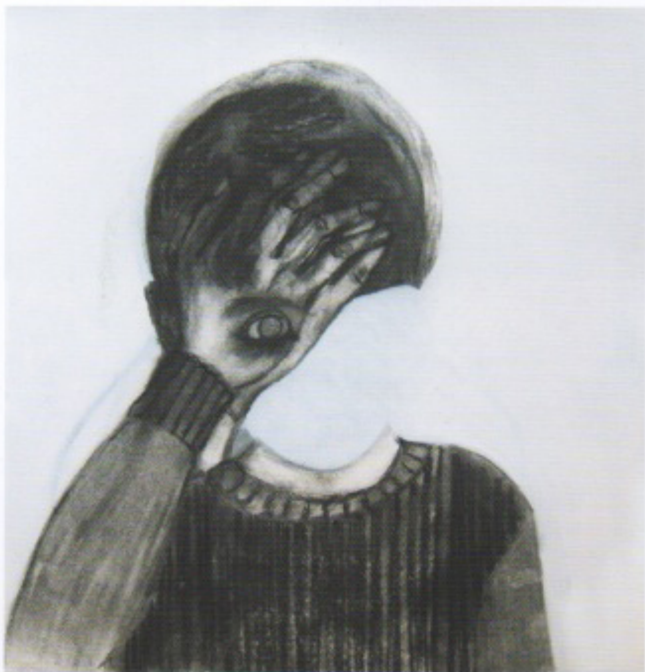
• Juda I • - fusain, pierre noire et craie sur papier - (90 x 98 cm) - 2003 © J. Davies